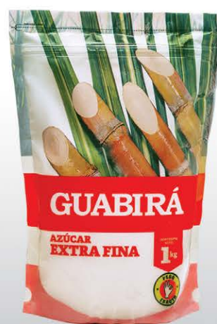
AZÚCAR EXTRA FINA Calidad y sabor insuperable