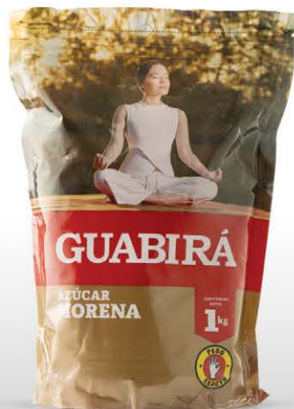
AZÚCAR MORENA 100% Natural