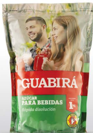
AZÚCAR PARA BEBIDAS Se disuelve fácil