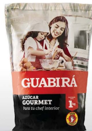
AZÚCAR GOURMET Especial para postres