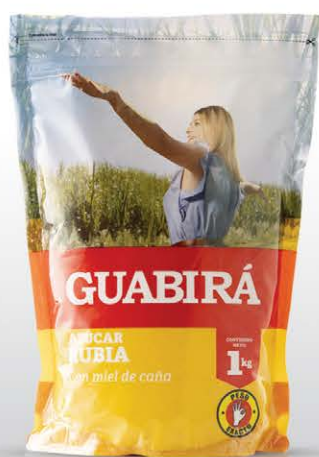
AZÚCAR RUBIA Aroma exquisito de caña